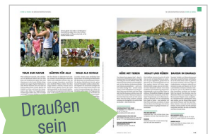
Beispiele vorherige Ausgaben.